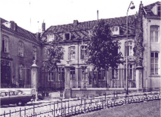
Klooster van St. Petrus Claver aan de Bouillonstraat

De Heilige Petrus Claver werd in 1580/81 geboren in Spanje. Op 22 jarige leeftijd trad hij toe tot de Jezuïetenorde. Hij wijdde zijn leven aan de stichting van Missiewerken in West-Indië, in Bogota en in Columbia. Hij zou volgens de legende meer dan 300.000 mensen gedoopt hebben. Hij noemde zich zelf een Slaaf van de Slaven, maar na zijn heiligverklaring kreeg hij de eretitel: Apostel van de Negers. De Maastrichtse Missiezusters van St. Peterus Claver werken voor de missiewerken in de Derde Wereld. In het klooster worden kazuifels en rozenkransen voor missiepaters vervaardigd. Het klooster van de zusters van St. Petrus Claver maakt deel uit van het gebouwencomplex van de Poort van Eynenberch.