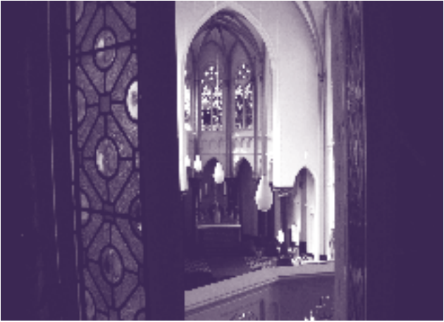
De kapel van het Ursulinenklooster gezien door het raampje van de ziekenboeg