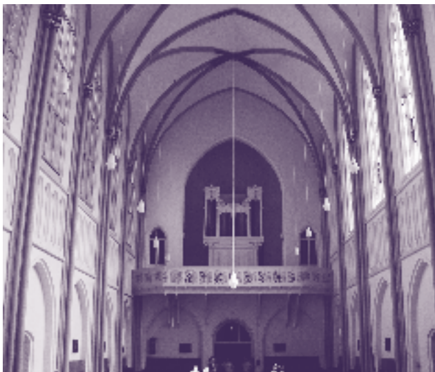
De kapel van het Ursulinenklooster aan de Grote Gracht 74

De kapel van de Zusters Ursulinen werd in 1890 gebouwd op het perceel Capucijnenstraat 122, naar een ontwerp van de Venlose architect Johannes Kayser. Het is een driebeukige basilicale kerk met een vijfhoekige koorafsluiting; de gevels zijn geleed door steunberen met luchtbogen, waartussen lange lancetvensters met rozetten zijn aangebracht. Rond de kapel is een kloostergang aangebracht en op de verdieping liggen twee ziekenkamers. Via een klein raampje konden de zieke zusters toch de getijden en missen meevieren.