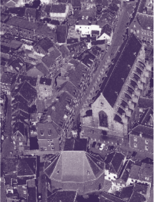
Franciscanen klooster en op de voorgrond de Waalse Kerk

Ambrosius en de stigmatisering van Sint Franciscus. Op de scheidingswand tussen het koor en het kerkschip is een schildering aangebracht met de Verkondiging aan Maria. In de kerk is een aantal grafzerken bewaard gebleven, waarvan de oudste dateert uit 1266.