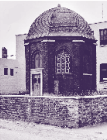
St. Lambertuskapel aan de Lage Kanaaldijk

Dit jaar wordt herdacht dat de heilige Lambertus in het jaar 705 te Luik werd vermoord. Zijn lichaam is daarna in een kapel te St. Pieter begraven. In de dertiende eeuw werd op dezelfde plaats een grotere kerk gebouwd, maar toen waren de stoffelijke resten van St. Lambertus al naar de kathedraal van Luik overgebracht. De huidige Sint Lambertuskapel werd in het jaar 1847 gebouwd ter vervanging van een oudere kapel, die was gesloopt in verband met de aanleg van het kanaal naar Luik.