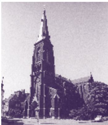
St. Martinuskerk aan de Rechtstraat