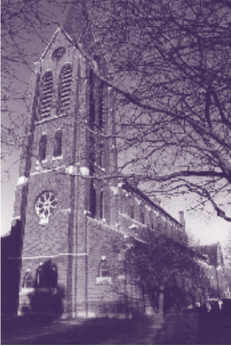
De kerk van Wolder