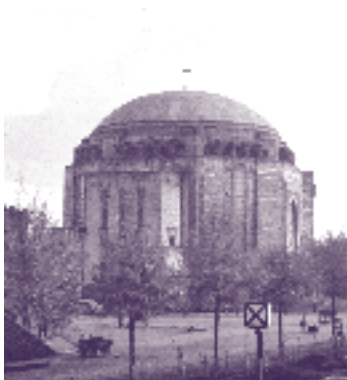
De Koepelkerk na de voltooiing van de eerste bouwfase in 1925