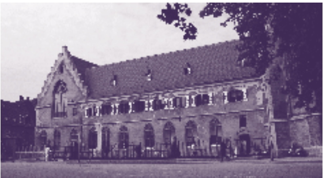
Kruisherenklooster aan de Kommel