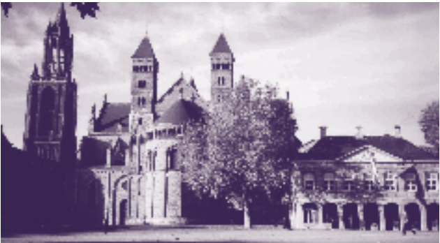
Kerkenensemble aan het Vrijthof

De Sint Servaaskerk werd al in de zesde eeuw gememoreerd door Gregorius van Tours, die het bouwwerk typeerde als een Magnum Templum: een grote kerk boven het graf van de heilige Servatius, de eerste bisschop van Maastricht. Op de plaats van het Magnum Templum werd in de achtste eeuw een driebeukige basilica gebouwd. In het begin van de elfde eeuw werd deze basilica geheel vernieuwd tot een sobere pijlerbasilica met een vlak gedekt middenschip. De nieuwe basilica werd in 1039 gewijd en van deze kerk is het kolenzandstenen muurwerk in het exterieur nog herkenbaar boven de daken van de zijbeuken.