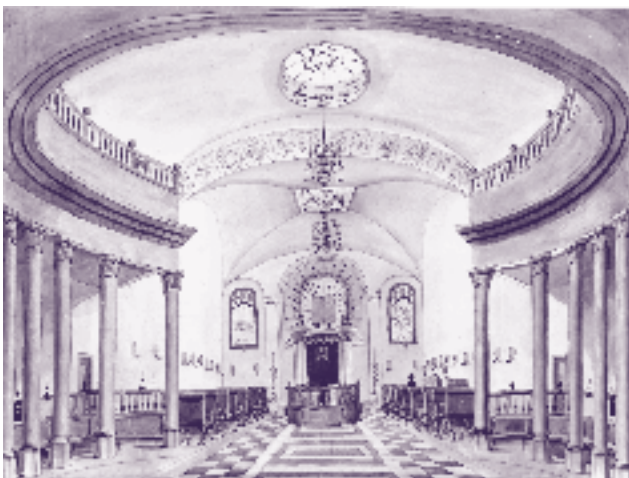
Synagoge aan de Capucijnengang: tekening van Ph. Van Gulpen

Het ontwerp van de Maastrichtse synagoge is van Matthijs Hermans. Op 26 juni 1840 was de bouw voltooid. Het pand is in neoclassicistisch stijl gebouwd met een absis, waarin de entree van het gebouw ligt. Aan de oostzijde zijn in het Hebreeuws de namen van de twaalf stammen van Israël vermeld. Daaronder is een rondboogvenster waarin een voorstelling van twee stenen tafelen met de Tien Geboden. De zijvleugels waren bestemd voor een klaslokaal, de kosterswoning, een vergaderruimte en een ritueel bad. In het interieur vormen de voorstelling van de stenen tafelen de bekroning van de kast met de Thora-rollen.