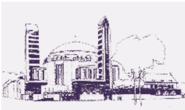
Koepelkerk aan de Heerderweg: het oorspronkelijk ontwerp uit 1921 met 2 torens