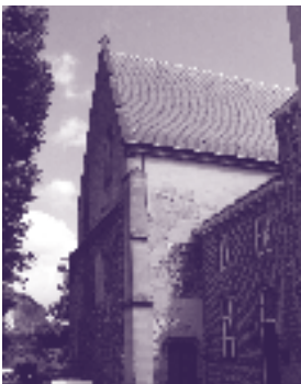
St. Andriesskerk aan de Maagdendries

Maagdendries bewonderen. De tentoonstelling is gemaakt in samenwerking met de Stichting Maastricht 1867.