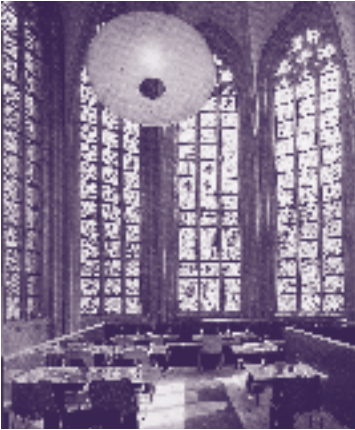
Kruisherenkerk: interieur van het KruisherenHotel

Het Kruisherenklooster dateert uit de vijftiende eeuw. De eerste steen werd in 1440 gelegd; de kerk is in mergelsteen gebouwd op een plint van hardsteen. In het schip dragen de hardstenen zuilen fraaie kapitelen met bladornamenten en een netgewelf met kruisribben. In de derde kapel zijn schilderijen aangebracht, die het leven van de H. Gertrudis voorstelden. In het koor zijn in 1461 gewelfschilderingen door 'meester Gerardus' aangebracht. Het Kruisherenklooster heeft veel bestemmingen gehad: Garnizoensbakkerij, Landbouwproefstation, Operahuis en onlangs werd het KruisherenHotel geopend.