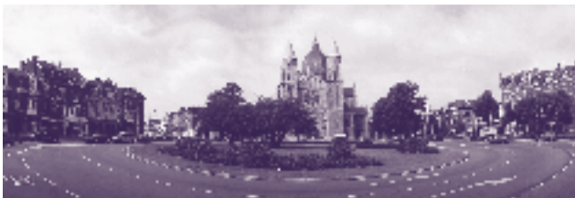
St. Lambertuskerk Koningin Emmaplein

De Lambertuskerk is in 1913 ontworpen door architect J.H.H. Groenendael uit Den Bosch. Het ontwerp combineert een centraalbouw met een kruiskerk. De centraalbouw is bekroond met een uivormige koepel van 43 meter hoog. De kerk bezit veel waardevolle beeldende kunstuitingen zoals het gebeeldhouwd portaal van Wim van Hoorn, gewelfschilderingen van de Benedictijner monnik Francois Mes en glas-in-lood vensters van Joep Nicolas en Henri Jonas.