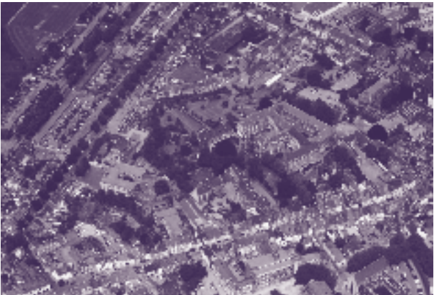
Klooster van de Beyart: luchtfoto

Brusselsestraat 38 en bij de tuinpoort aan Hoog-Frankrijk: De kloostertuin is tijdens het Monumentenweekend opengesteld voor het publiek van 10.00 tot 17.00 uur. Om 14.00, 15.00 en 16.00 uur worden er rondleidingen verzorgd in de kloostergebouwen en door de St. Aloysiuschool. In de kloostergangen is een kleine expositie ingericht over het leven en werken van de broeders. Deze rondleidingen zijn alleen mogelijk met reserveringskaartjes die gratis verkrijgbaar zijn bij de VVV Maastricht.