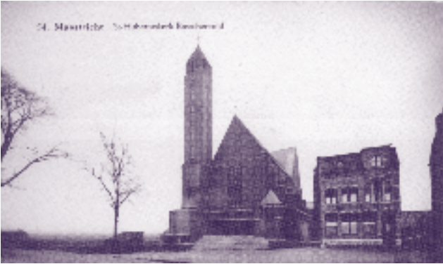
St. Hubertuskerk aan de Boscherweg 161

Het programma wordt aangepast als er een eredienst in de kerk wordt gehouden.