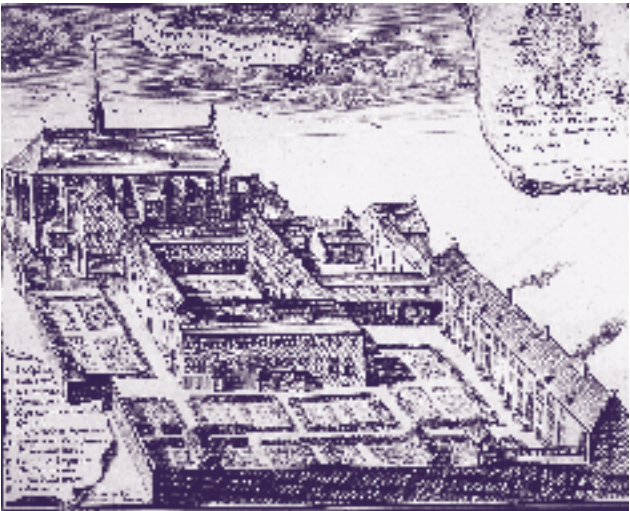
Dominicanenklooster: gravure uit 1717