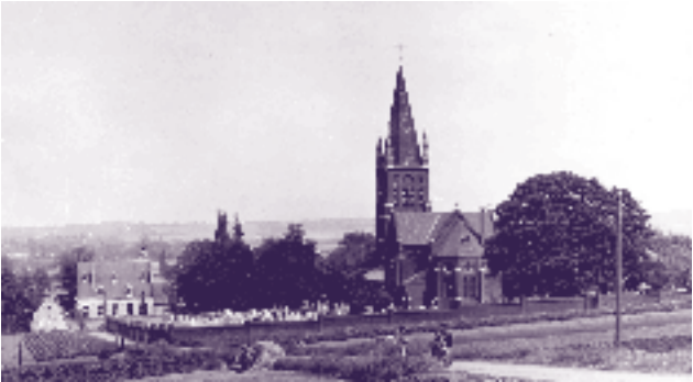
Kerk van St. Pieter op de Berg aan de Ursulinenweg