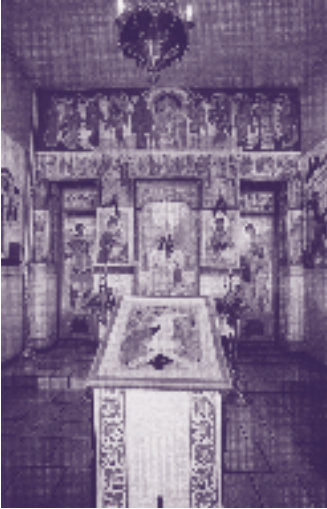
Russisch Orthodoxe Kerk aan de St. Maartenslaan