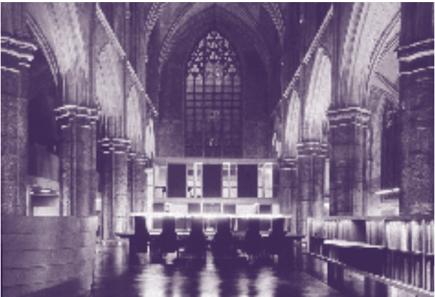
Het Regionaal Historisch Centrum voor Limburg

In het koor van de kerk kan men de expositie "Pijen en Pistolen" bewonderen. Deze tentoonstelling gaat over de Franciscaner Orde, het Franciscanenklooster en de latere bestemmingen van dit bijzondere kloostercomplex, dat in de periode tussen 1992 en 1996 werd gerestaureerd. Hier is een sublieme synthese gerealiseerd tussen de authentieke cultuurwaarde van het monument en de moderne gebruikerseisen van het archief.