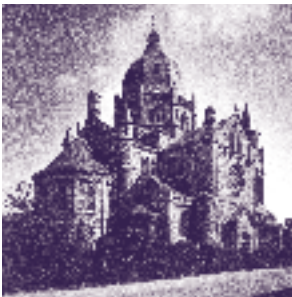
St. Lambertuskerk Koningin Emmaplein

Deze tentoonstelling gaat over de herbestemming van de St. Lambertuskerk en toont de plannen van de architectenbureaus die meegewerkt hebben aan de besloten prijsvraag voor de herbestemming van de kerk. De gemeenteraad heeft zich onlangs uitgesproken voor het plan van de Woningstichting Servatius, die in de zijbeuken van de kerk een kantoorfunctie wil realiseren. Daarnaast zijn er foto's van de fotograaf Aart de Bakker te zien en kan men de maquette bewonderen die in 1915 is gemaakt door het architectenbureau van J. Van Groenendaël.