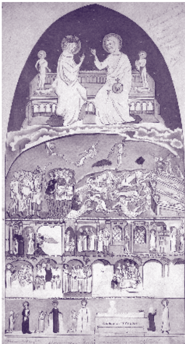
Schildering in de Dominikanenkerk: tekening door Johannes Brabant 1867