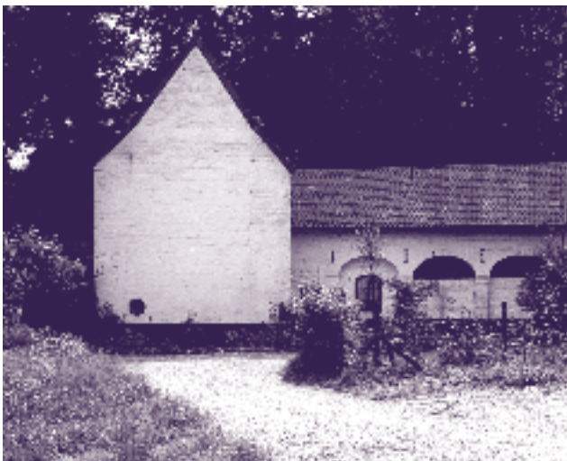
Restanten van het klooster van de Observanten

De wandeling voert langs de kerk en de pastorie van St. Pieter; het kerkhof en de Lourdesgrot, de St. Rochuskapel, de kapel van Slavante en de resten van het klooster van de Observanten. De wandeling eindigt bij het museum op de Lichtenberg, alwaar men de expositie over de St. Lambertuskapel kan bewonderen.